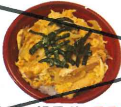
伊勢鶏の親子丼 550円