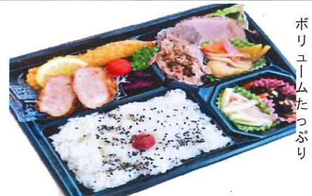
特上幕の内弁当 1080円