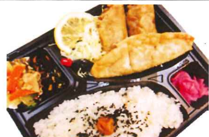
津ぎょうざ君弁当 650円