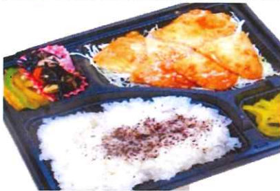
豚しょうが焼き弁当 650円