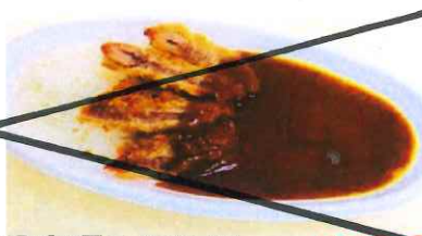
国産豚のカツカレー 550円