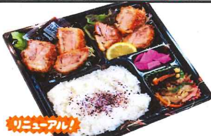
豚ヒシカツ弁当 750円