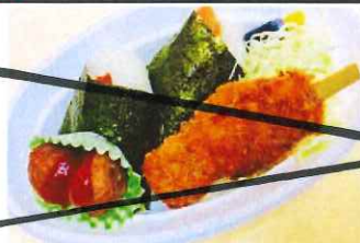
おむすびころりん 550円