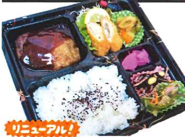
ハンバーグ弁当 750円