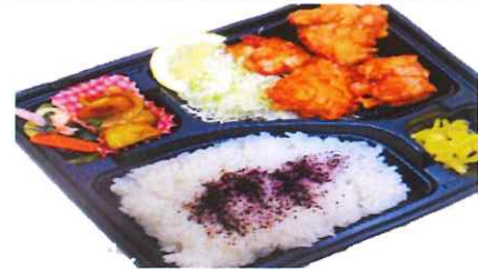
鶏からあげ弁当 650円