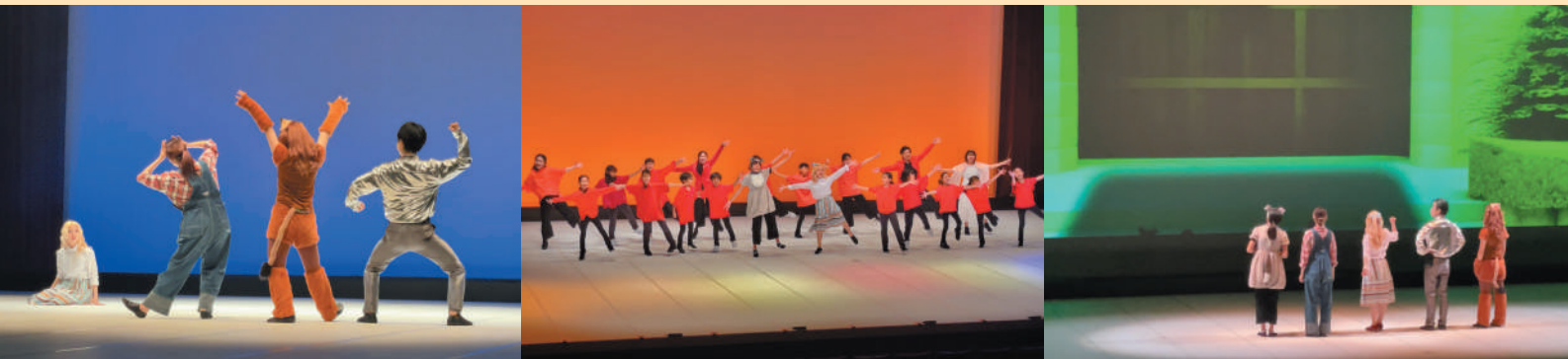
アルスこども創造プロジェクト2023「こどもミュージカル版 オズの魔法使い」より