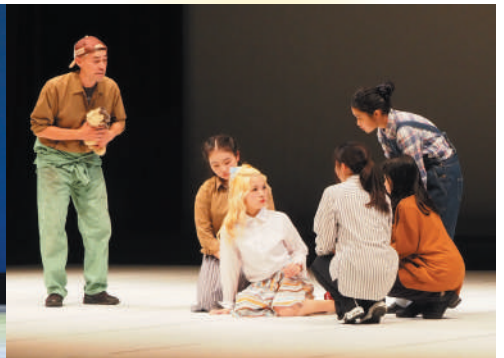
アルスこども創造プロジェクト2023「こどもミュージカル版オズの魔法使い」より