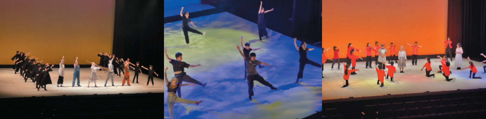
アルス子ども創造プロジェクト2023「こどもミュージカル版オズの魔法使い」より