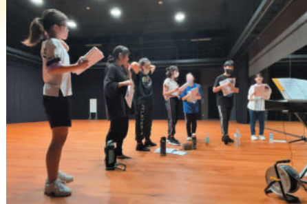
アルス子ども創造プロジェクト2023 稽古風景