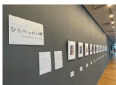
※2022年度実施、参加者作品展「ひらべったい町」開催風景