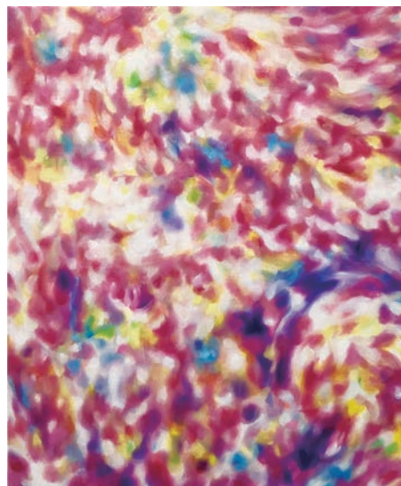
【アルスの風 2022春号】 「はるそよぐ」