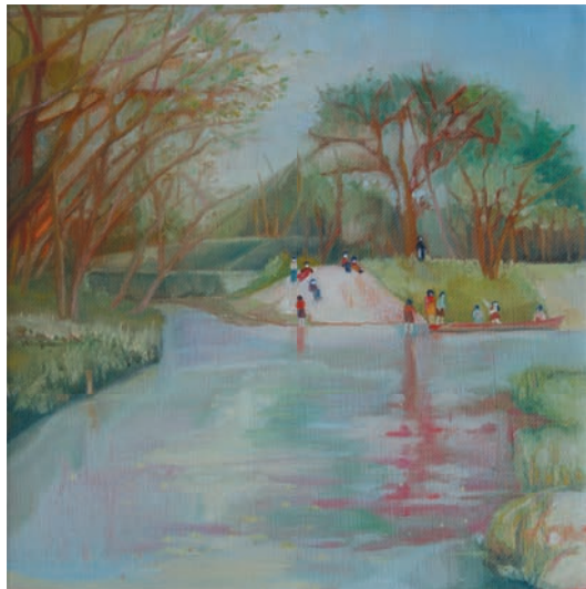
【アルスの風 2021夏号】「在りし日の景色」

津市久居アルスプラザ季刊誌「アルスの風」の装画を描いた津市にゆかりのある4名の作家による展覧会