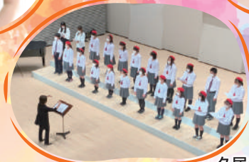
久居少年少女合唱団 (合唱)