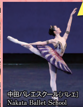
中田バレエスクール[バレエ] Nakata Ballet School