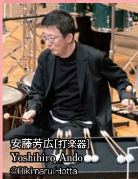
安藤芳広[打楽器] Yoshihiro Ando