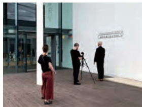
第7・8回の撮影風景